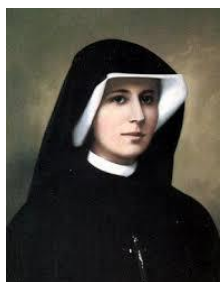
ŚW. FAUSTYNA - sekretarka Bożego Miłosierdzia

Urodziła się 25 sierpnia 1905 r. w Głogowcu k. Łodzi. W 1925 r. wstąpiła do Zgromadzenia